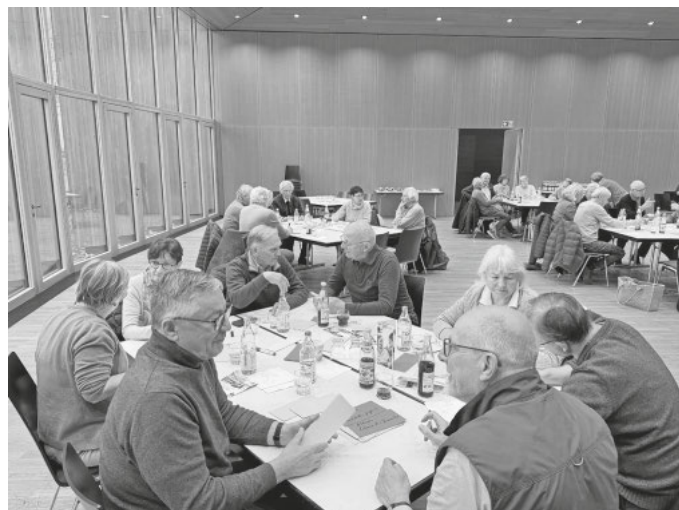
Beteiligung, die Spaß macht: Eifrig diskutiert wurde bei den beiden Dorfgesprächen im März (hier im Bild: in Owingen).