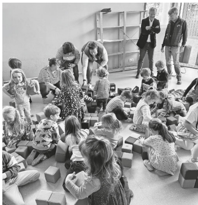
Mit großer Freude entdecken die Kinder die neuen Bausteine und legen sofort voller Begeisterung mit dem Bauen los.