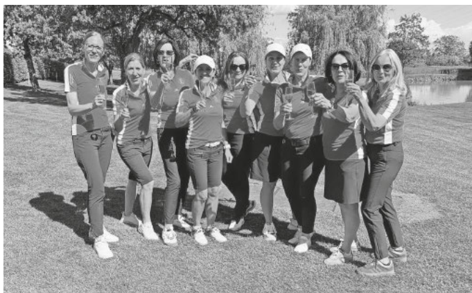
Die erfolgreiche Damenmannschaft

Nach vielen Jahren in der 1. Liga mit der AK 30 und drei Final-Four-Teilnahmen schlägt das Team mit diesem erfolgreichen Einstand ein neues Kapitel auf – in neuer Konstellation und in ihrer ersten gemeinsamen Saison in der 3. Liga. Möglich wurde der Neustart durch personelle Veränderungen: Einige Spielerinnen der früheren AK 30 bündeln ihre Kräfte mit motivierten Neuzugängen, um in der Altersklasse 50 wieder anzugreifen. Beim Heimspiel passte einfach alles: strahlender Sonnenschein, ein top gepflegter Platz und eine Mannschaft, die mit spürbarer Spielfreude und echtem Teamgeist auftrat. Ein Auftakt, der Lust auf mehr macht.